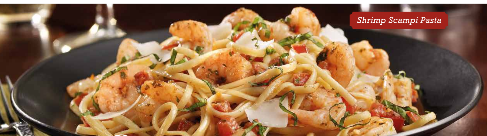
Shrimp Scampi Pasta

SEAFOOD SPECIALS Incluem 2 acompanhamentos: Arroz pilaf e brócolis cozido ao vapor..