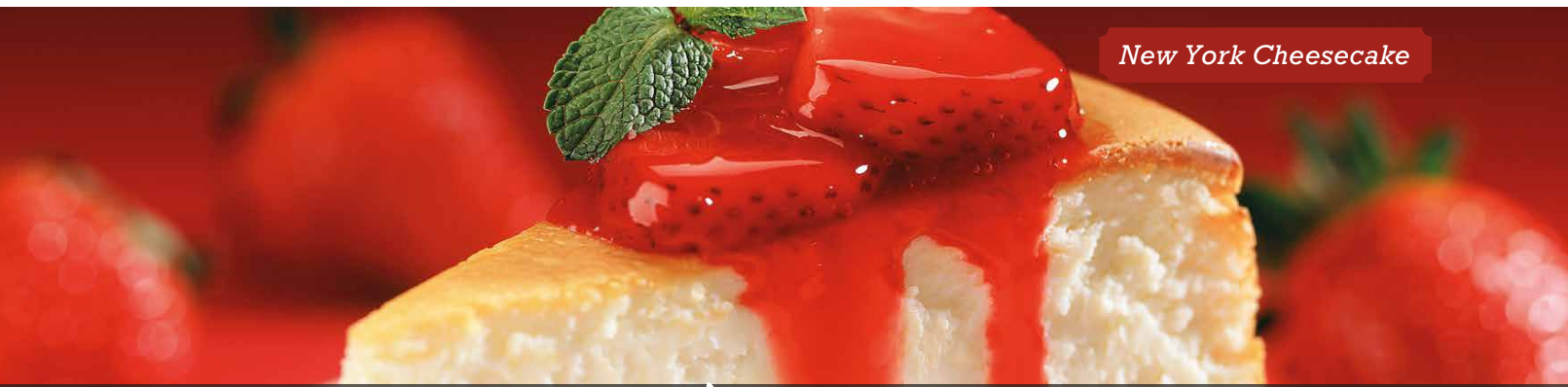
New York Cheesecake

Frango frito com molho gravy. Servido com dois acompanhamentos a sua escolha.