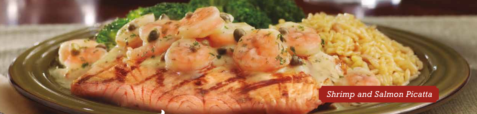
Shrimp and Salmon Picatta