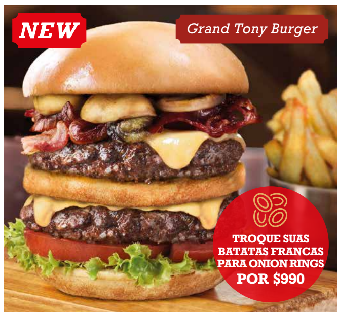
Grand Tony Burger

Hambúrguer angus grelhado com queijo gouda, bacon, aros de cebola crocantes e ovo estrelado. Tudo com molho de maionese.