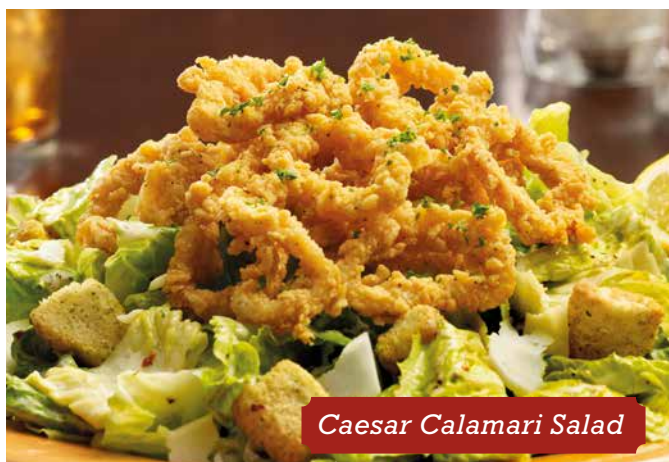
Caesar Calamari Salad

Pedaços de peito de frango grelhados com tomate desidratado e espinafre, coberto com o molho Alfredo e um toque de limão. Servido com a massa de linguini e coberto com queijo parmesão e salsa fresca.