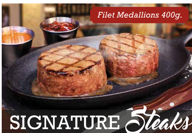
Filet Medallions 400g.

FULL RACK 680g. · $18.990 | 450g. · $16.990 HALF RACK 340g. · $15.490